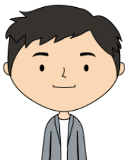
新規話者 けんた （感情対応）